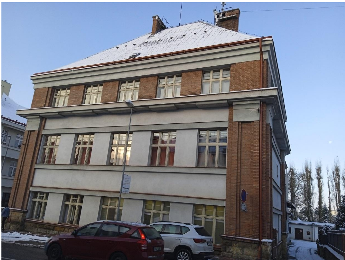
č. 2: Pohled na východní fasádu Domova mládeže Jičín z ulice Českých bratří, 30. 11. 2023.