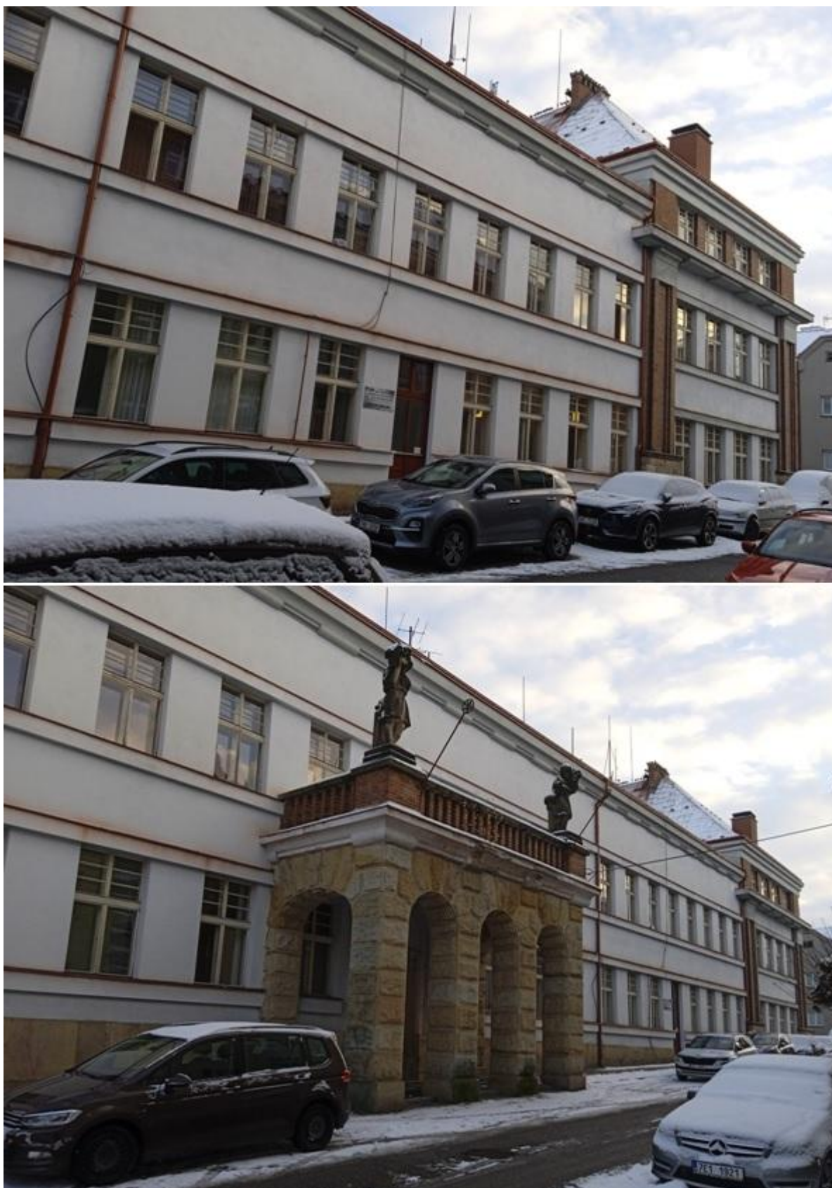
č. 1: Pohledy na jižní fasádu Domova mládeže Jičín z Denisovy ulice, 30. 11. 2023.