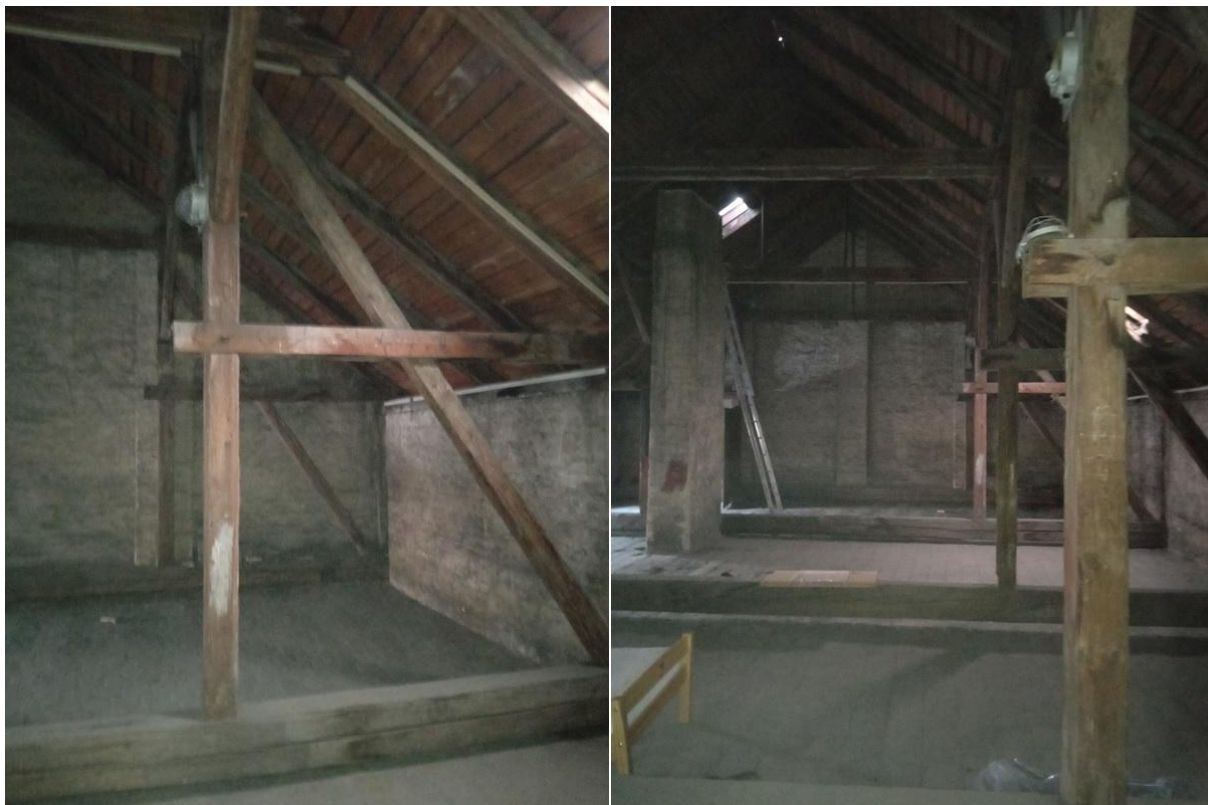
č. 3: Půdní prostor v západní části objektu, 30. 11. 2023.