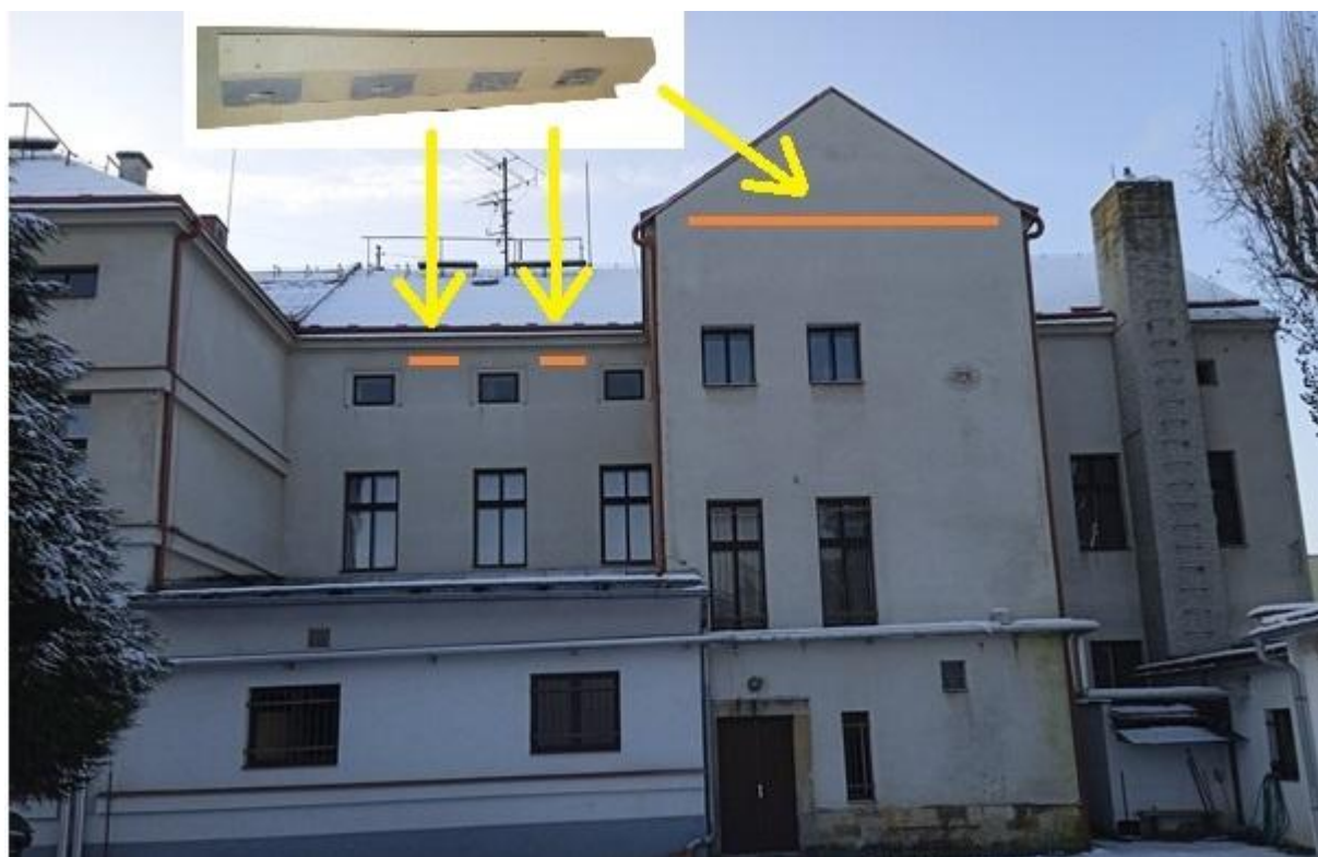
č. 5: Vhodná místa na severních stěnách objektu k instalaci budek pro rorýse do kontaktního zateplení.