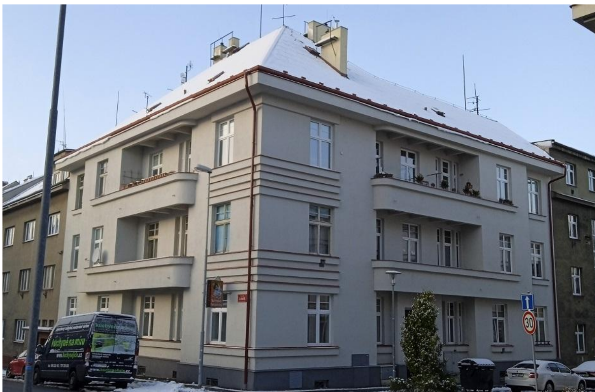
č. 4: Nedávno rekonstruovaná protilehlá budova Denisova č. p. 427, na které bylo v roce 2011 prokázáno hnízdění 2–10 párů rorýse obecného ( Apus apus ).